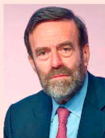
G. de la Dehesa, exsecretario de Estado y consejero de Santander.