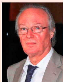
Josep Piqué, exministro de Asuntos Exteriores.