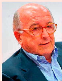
Joaquín Almunia, exministro y vicepresidente de la Comisión.

Aunque el grupo de economistas y académicos españoles acepta y proclama la nece-