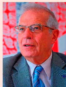
Josep Borrell, exministro y presidente de la Eurocámara.